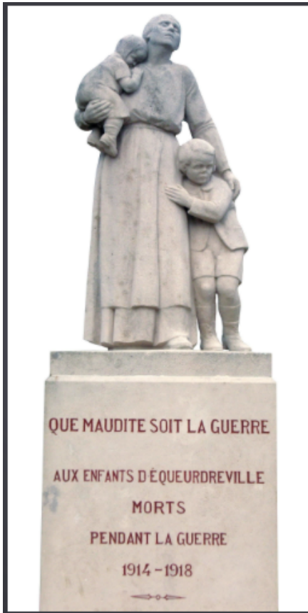
Monument aux morts d'Équeurdreville (Manche), 1932.

Les années 1920 sont marquées par une « fièvre commémorative ». Les villages construisent des monuments aux morts. Un soldat inconnu est placé sous l'Arc de Triomphe, à Paris, le 11 novembre 1920. Un ossuaire est construit à Verdun.