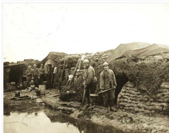
Soldats français dans les tranchées en Flandres en 1917.