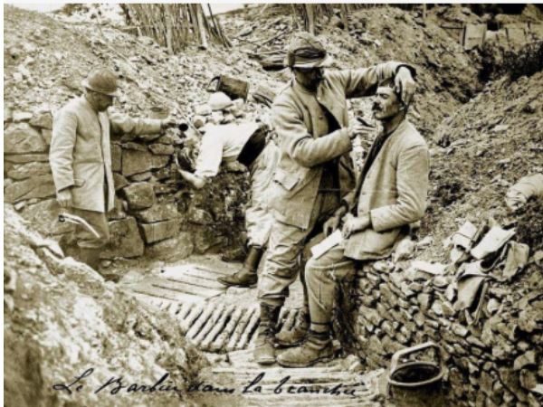
Soldats français dans les tranchées, date et lieu inconnus.

Def violence de masse : ensemble des violences qui affectent les populations, directement ou indirectement