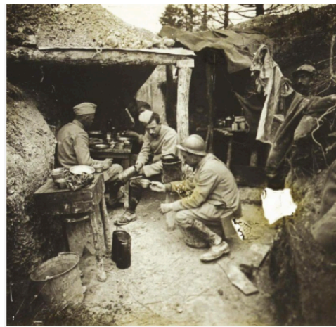
Soldats français dans les tranchées, date et lieu inconnus.