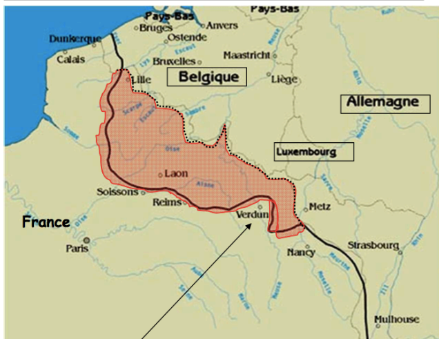
Situation de Verdun sur le front occidental à la veille de la bataille

La configuration du front à Verdun donne un avantage stratégique à l'Allemagne. La position française forme un saillant dans les lignes allemandes, elle peut être bombardée des deux côtés.