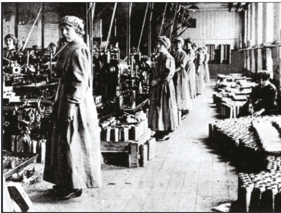
Une usine de production d'obus en Écosse, 1915.

Les femmes travaillent dans les usines d'armement et dans les champs pour assurer l'approvisionnement du front.