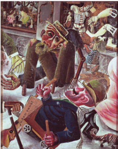
Otto Dix, La Rue de Prague , 1920 (Kunstmuseum, Stuttgart).