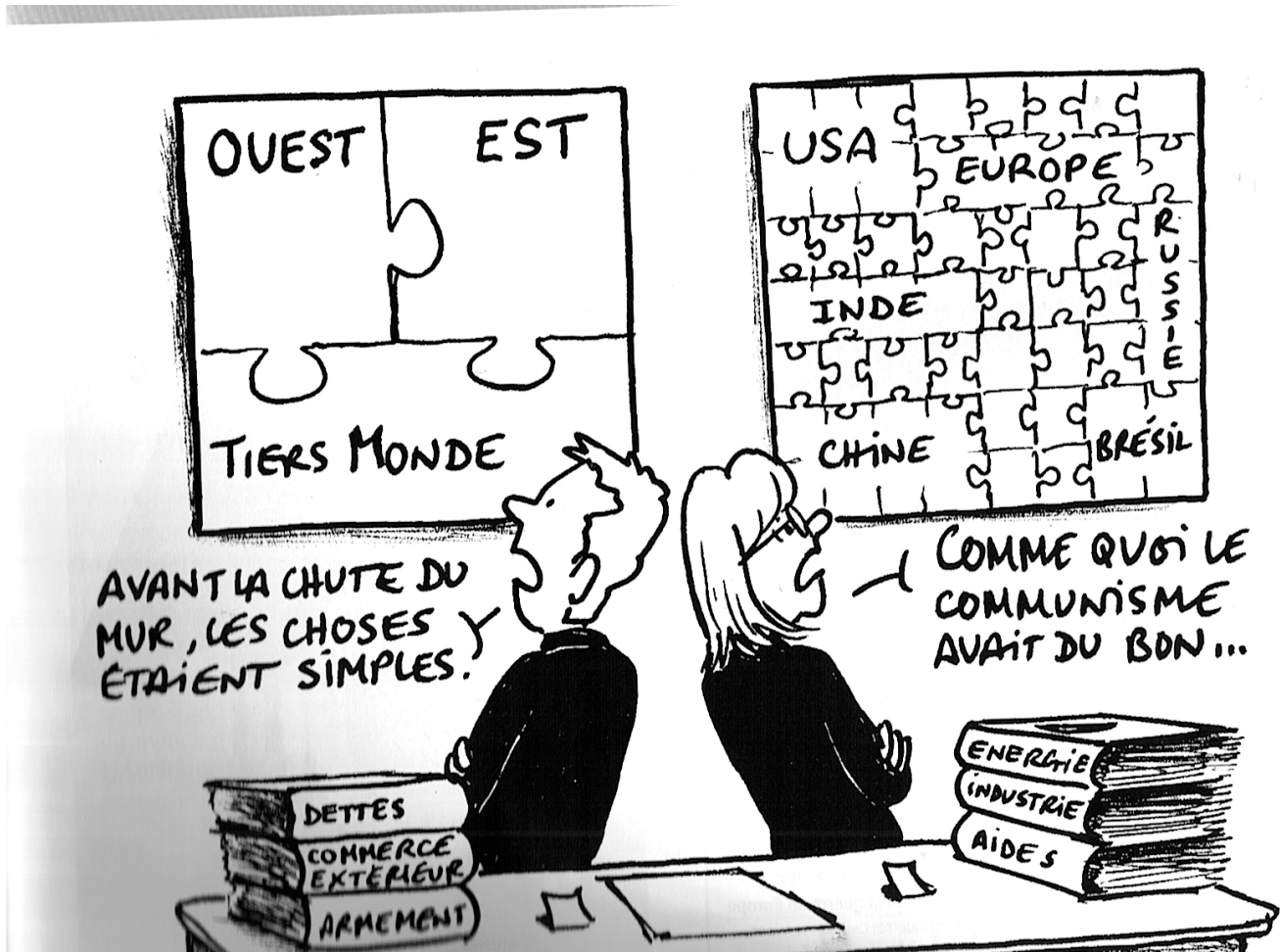
Caricature de Chalvin, 2009

Problématique : Quelles sont les nouvelles logiques de fonctionnement du monde depuis les années 1990 ?