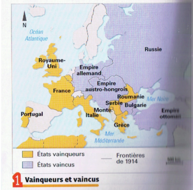
1 et 4 p. 38 : La nouvelle carte de l'Europe