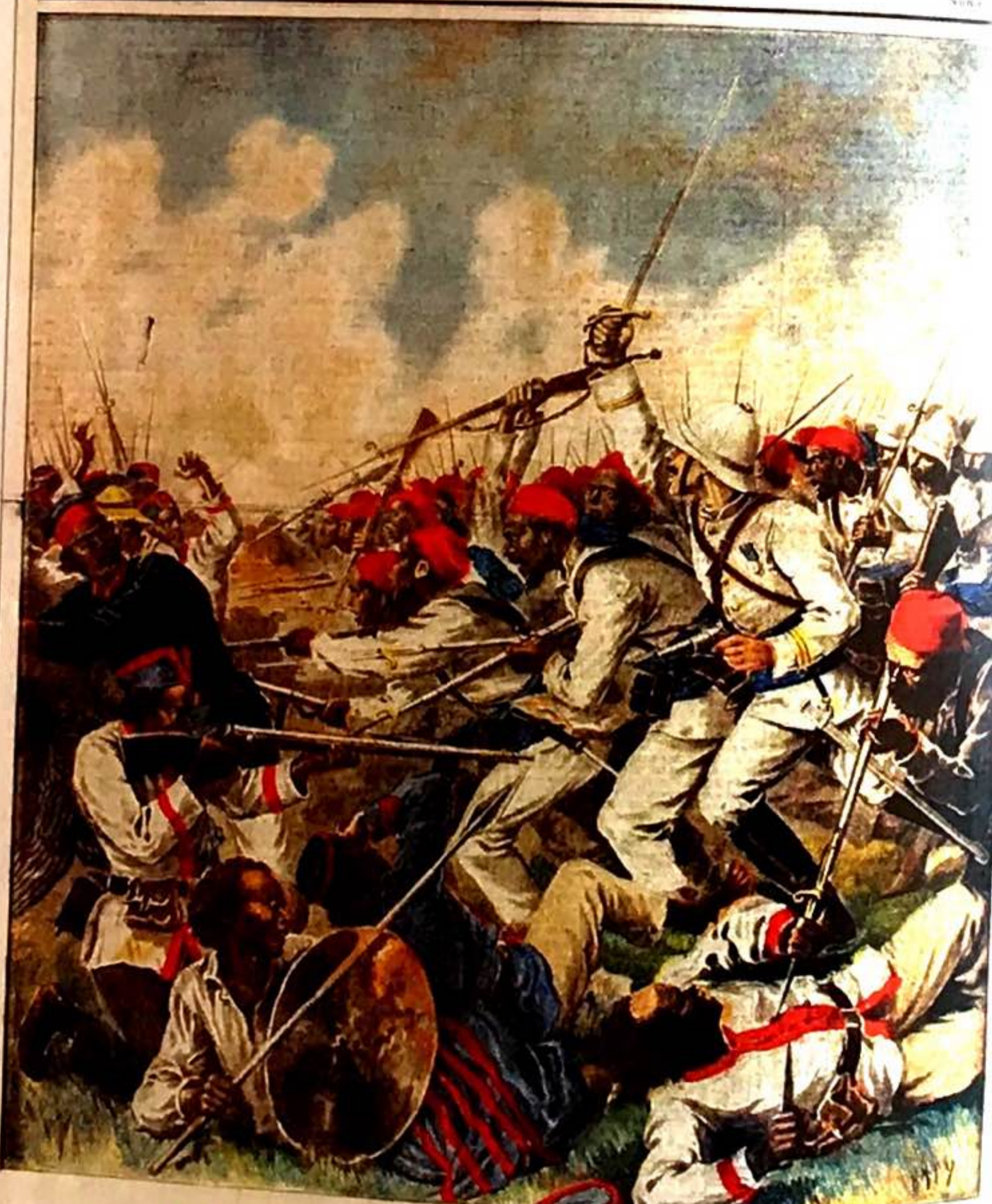
EXPÉDITION DE MADAGASCAR Prise d'un camp hova

Le Petit Journal SUPPLÉMENT ILLUSTRÉ Huit pages : CINQ centimes DIMANCHE 2 JUIN 1895