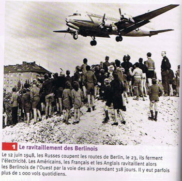
1 Le ravitaillement des Berlinois

Depuis 1945, l'Allemagne et Berlin sont divisées en plusieurs zones occupées par les Alliés et les Soviétiques. En 1948, l'URSS décide de mettre la main sur Berlin-Ouest, zone d'occupation alliée, en établissant le blocus sur cette partie de la ville. Mais il échoue à cause du pont aérien établi par les Américains. En 1949, à la suite du blocus, l'Allemagne est divisée en deux États : la République démocratique allemande (RDA), communiste, correspondant à la zone soviétique, avec Berlin-Est pour capitale, et la République fédérale allemande (RFA) qui correspond aux zones alliées et qui comprend Berlin-Ouest, pourtant situé au cœur de la RDA.