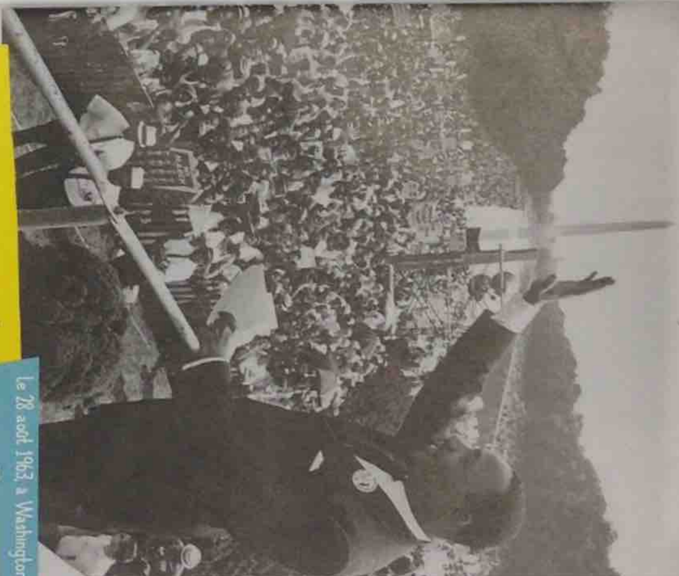
Le 28 août 1963, à Washington.

« Le rêve que mes quatre petits-enfants vivront un jour dans un pays où on ne les jugera pas à la couleur de leur peau, mais à la nature de leur caractère. Je fais aujourd'hui un rêve ! »