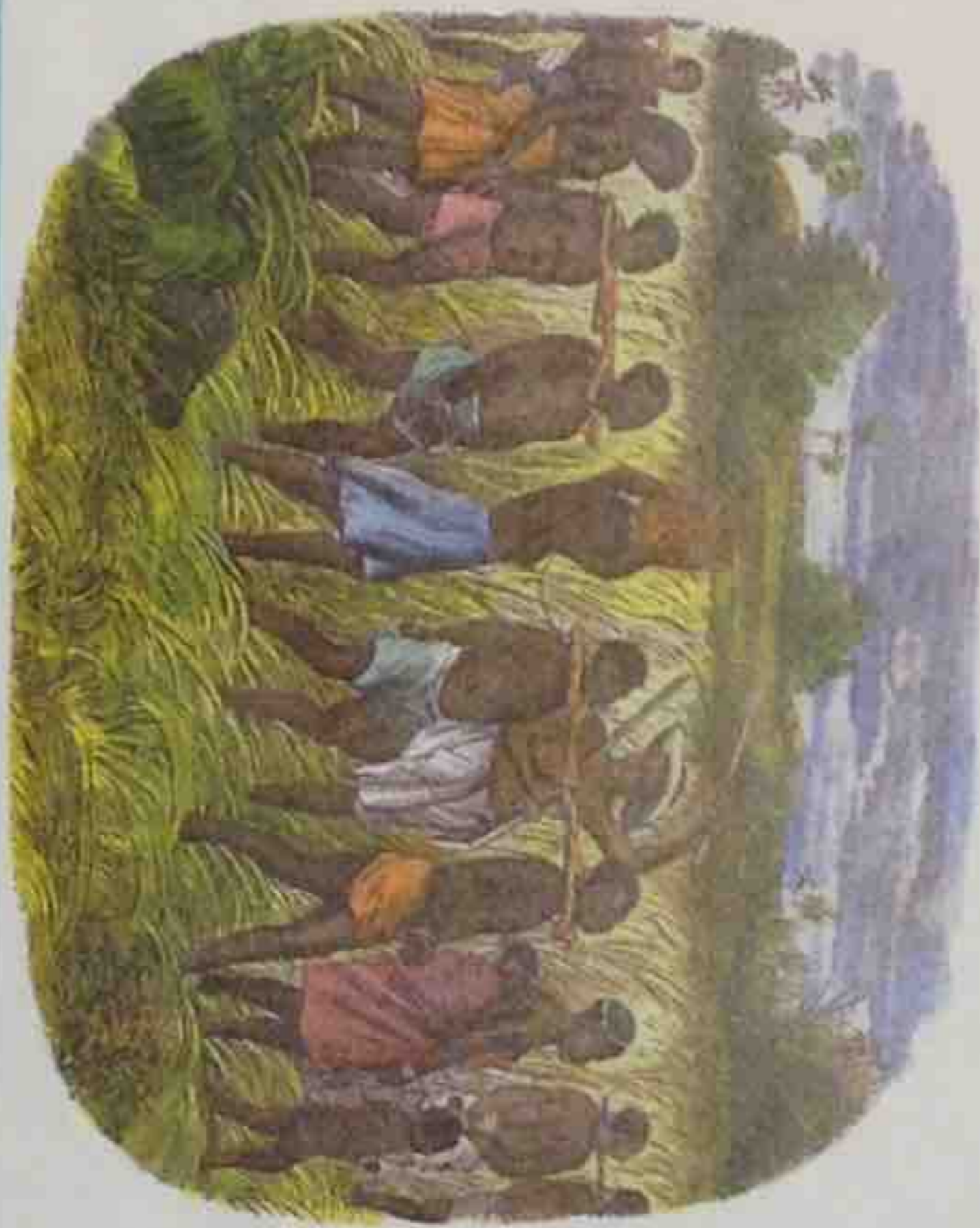
Comme beaucoup de Noirs américains, Martin descend des esclaves amenés d'Afrique au XVIII e pour travailler dans les plantations du sud des États-Unis.

Martin Luther King naît en 1929 dans le sud des États-Unis, à Atlanta. L'esclavage y a été aboli plus de soixante ans auparavant. Mais les Noirs et les Blancs ne sont toujours pas égaux ! À 6 ans, Martin découvre le racisme : un copain blanc lui annonce qu'il n'a plus le droit de jouer avec lui... à cause de sa couleur de peau.