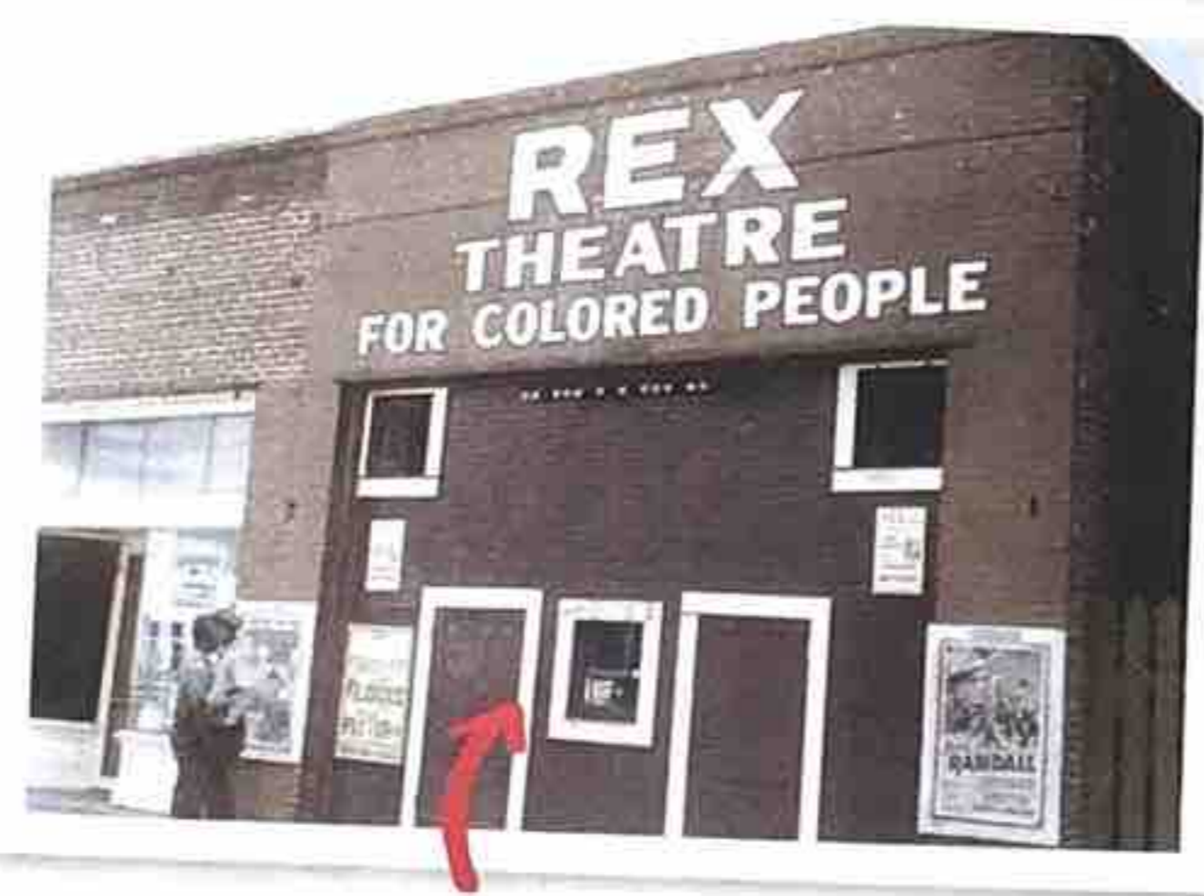
Pendant la ségrégation raciale, noirs et blancs ne peuvent pas fréquenter les mêmes cinémas.

Joséphine Freda McDonald naît en 1906, aux États-Unis, dans une famille pauvre. À 8 ans, pour gagner un peu d'argent, elle est bonne à tout faire... mais ce qu'elle aime par-dessus tout, c'est chanter et danser. En grandissant, elle parvient à rejoindre une troupe d'artistes, avec laquelle elle part en tournée. Son rêve est de pouvoir un jour se produire dans un grand théâtre de New-York, mais c'est impossible. En effet, à l'époque, le racisme fait rage aux États-Unis. Considérés comme inférieurs aux blancs, les noirs sont obligés de vivre séparés. Des lois décrètent qu'ils ne peuvent pas habiter les mêmes quartiers que les blancs ou s'inscrire dans les mêmes écoles. C'est ce qu'on appelle la ségrégation raciale.